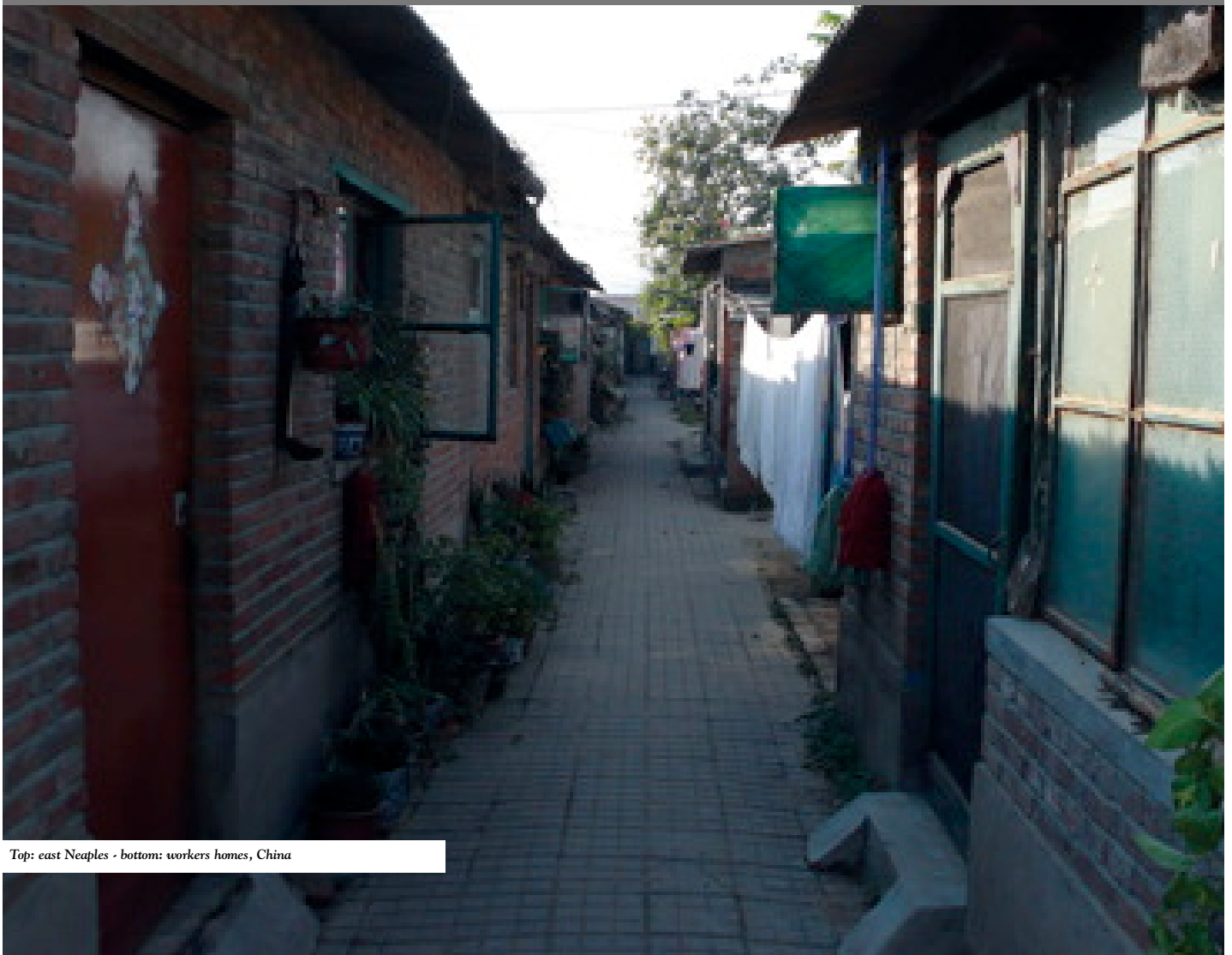
Top: east Naples - bottom: workers homes, China

The discipline, the skill that we have to transmit to aspiring architects is the indirect one of entering into a dialogue with society La disciplina, la competenza, che dobbiamo trasmettere agli aspiranti architetti, è quella indiretta di aprire un dialogo con la società